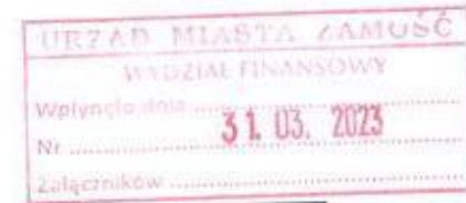
Tabela Nr 1.12