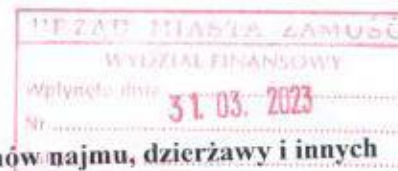
Tabela Nr 1.5